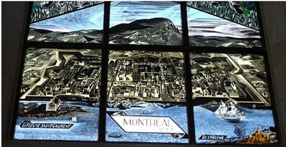
Vitrail de Montréal en 1724 dans l'église de Brouage.