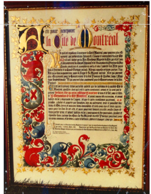
Acte pour incorporer la Cité de Montréal.